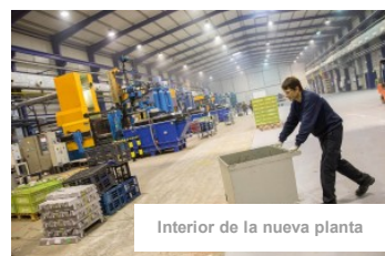
Interior de la nueva planta

La creación de 60 puestos de trabajo se realizará a lo largo de este año. Actualmente, se han contratado a 25 personas y se prevé que antes de fin de año ya estén todos los empleos ocupados. "Hemos sido prudentes a la hora de estimar los nuevos puestos. Los de estructura como encargados, ingenieros y jefes de producción, logística y